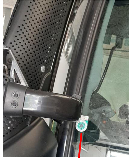
Pickerl 40 km/h